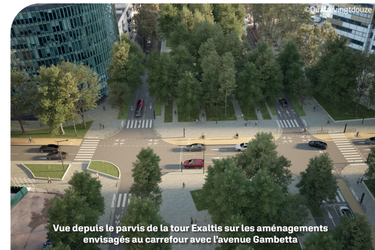
Vue depuis le parvis de la tour Exaltis sur les aménagements envisagés au carrefour avec l'avenue Gambetta