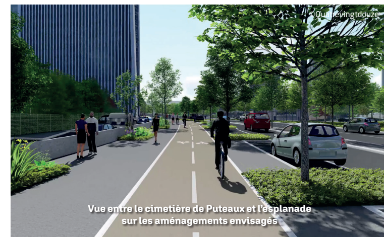
Vue entre le cimetière de Puteaux et l'esplanade sur les aménagements envisagés