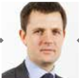
Sergey KUZNETSOV City of Moscow Chief Architect Russie